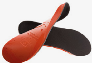
#MEM Semelles en mousse à mémoire de forme IMP13001 À IMP13006