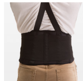
#BC Back Coach SOUTIEN LOMBAIRE