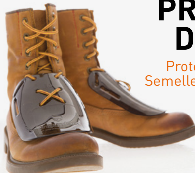
#METGUARD : à laçage #METSTRAP : courroies Protection métatarsienne vendues séparément IMP12028