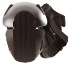
#825-00 GENOUILLÈRES À COQUE RIGIDE