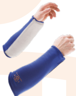
#805-10 PROTECTEUR AVANT BRAS