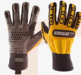
#WGRIGG Gants Dryrigger résistants à l'huile et à l'eau