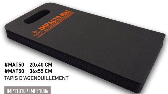
#MAT50 20x40 CM #MAT50 36x55 CM TAPIS D'AGENUILLEMENT