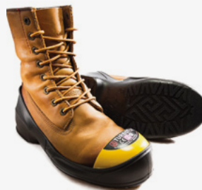
#TURBOTOE® Embout protecteur IMP12-001 À IMP12008