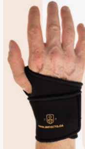
#TS226 Thermo Wrap Bande Serrepoignet Thermique Ambidextre

#501-20 - Cuir fleur IMP02001 À IMP02006