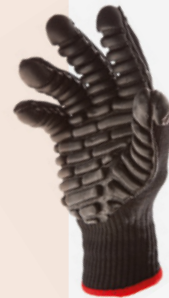
#BLACKMAXX ISO Réduit les vibrations