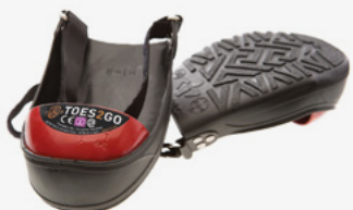
#TOES2GO® Embout protecteur en acier IMP12009 À IMP12011

Protection contre les chocs Semelles / Gamme antidérapante Support du pied