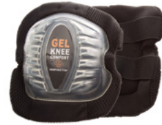
#864-00 GENOUILLÈRE GEL