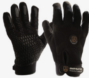
#BG408 Gants Air Glove® Antivibration

Gants antivibrations Gants antichocs Gants spécialisés / Support pour le poignet / Gamme Ergotech Maillets / Trousses de préhension anti vibrations