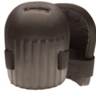
#840-00 GENOUILLÈRE MOUSSE

Genouillères en mousse Genouillère en gel confort Protection des jambes Support thermique Tapis et coussins